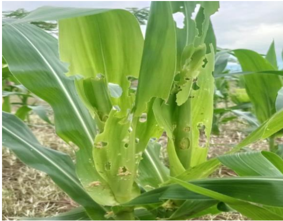
Gambar 2. Serangan larva S. frugiperda pada tanaman jagung 3 minggu setelah tanam

Hasil analisis rata-rata kepadatan populasi larva S. frugiperda pada tanaman jagung menunjukkan peningkatan kepadatan populasi pada setiap minggunya. Terlihat penggunaan perlakuan tanaman penolak-penarik ( Crotalaria juncea dan Brachiaria mulato II) mengalami peningkatan Populasi larva setiap pengamatan, tetapi tidak terlihat peningkatan populasi yang begitu tinggi hingga pengamatan 5 MST, berbeda pada tanaman jagung kontrol yang mengalami peningkatan yang cukup tinggi pada pengamatan 4 MST dan mengalami penurunan pada pengamatan 5 MST.