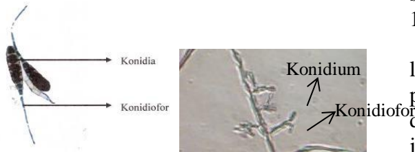
Gambar 1. Makroskopis dan Mikroskopis Jamur A. porri (Deptan, 2007).

Pengamatan secara makroskopis menunjukkan bahwa jamur A. porri dalam media PDA menghasilkan banyak miselium, koloni berwarna putih seperti kapas, kemudian berubah menjadi abu-abu kehitaman hingga hitam, koloni menyebar secara beraturan pada keseluruhan permukaan cawan petri. Secara mikroskopis menunjukkan adanya konidium dan konidiofor.