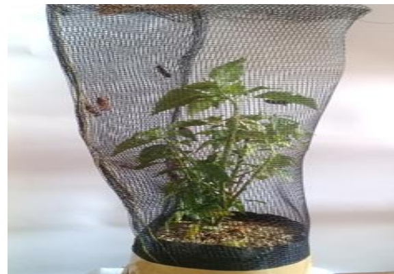
Gambar 1. Desain habitat tiruan jangkrik

Penelitian ini menggunakan metode eksperimen dengan Rancangan Acak Lengkap (RAL) Penelitian ini diawali dengan pembuatan habitat tiruan jangkrik seperti pada Gambar 1. Habitat jangkrik yang digunakan adalah tanaman cabai yang telah dibungkus dengan kasa plastik. Sebanyak 30 tanaman cabai dikelompokkan menjadi 10 perlakuan dengan 3 kali ulangan setiap kelompoknya. Sebanyak 420 ekor jangkrik gangsir digunakan sebagai hewan uji dengan masing-masing 14 ekor pada setiap habitat tanaman cabai.